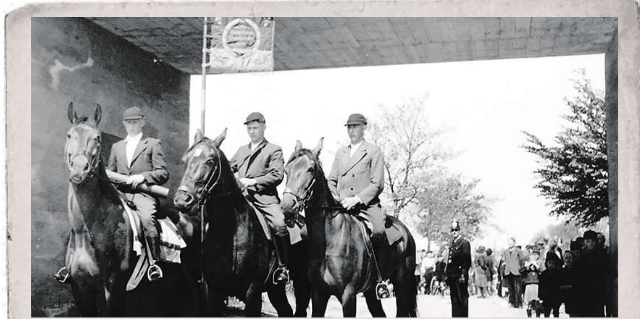
Eine Stafette des Reitvereins Bunde überbringt am 18. Mai 1951 hoch zu Pferde den Gruß des Rheiderlandes zur Wiedereröffnung der Friesenbrücke. Sie wissen mehr über dieses Foto? Schicken Sie uns Ihre Hinweise (bitte nur schriftlich) an sowasdat@rheiderland.de oder an RZ, »So was dat«, Risiusstraße 6-10, 26826 Weener.