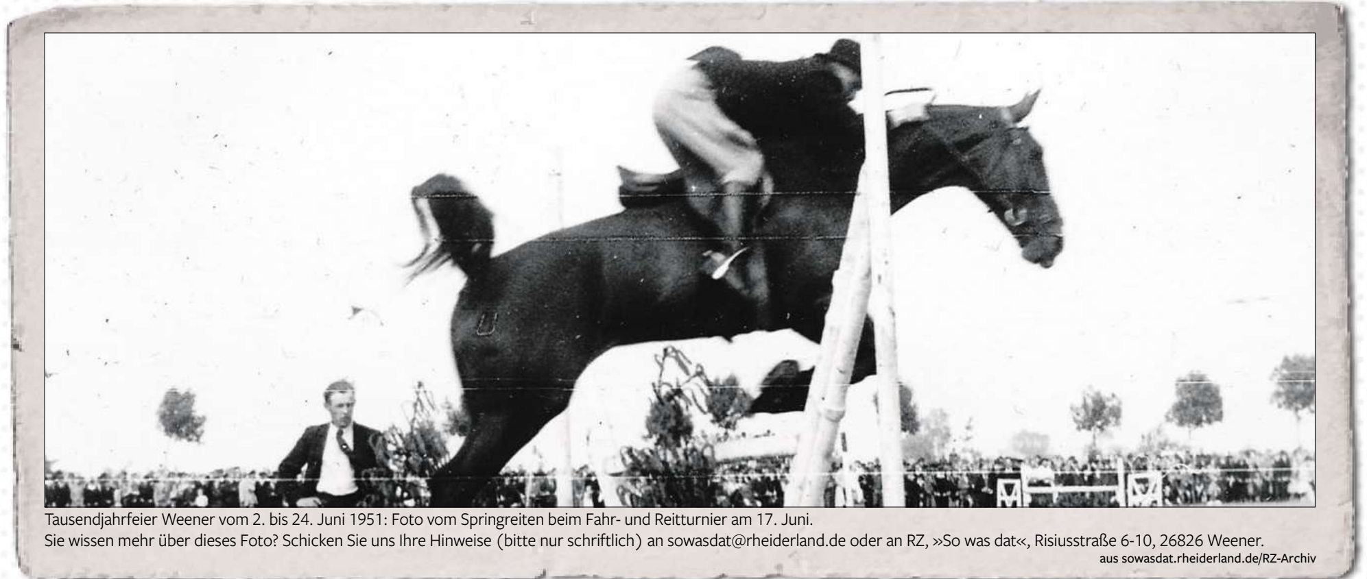
Tausendjahrfeier Weener vom 2. bis 24. Juni 1951: Foto vom Springreiten beim Fahr- und Reitturnier am 17. Juni. Sie wissen mehr über dieses Foto? Schicken Sie uns Ihre Hinweise (bitte nur schriftlich) an sowasdat@rheiderland.de oder an RZ, »So was dat«, Risisstraße 6-10, 26826 Weener.